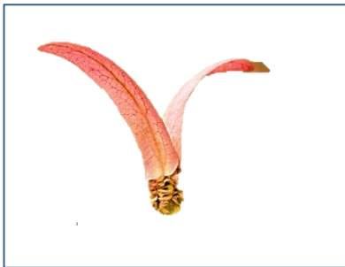
フタバガキのタネ

植物は仲間を増やすために、タネをたくさんつくります。 このフタバガキは、東南アジアの熱帯雨林の植物です。 タネに翼のようなものがついていて、プロペラのようにクルクルと回転しながら飛びます。 タネの問題にチャレンジ。