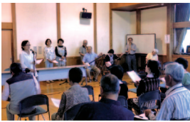
上・山形県民謡花笠音頭踊り発表 下・日立の民謡研修会風景

です。いずれも歴史があり、全国大会が行われております。磯節は四十回、江差追分は五十七回の大数を数えており、その土地の先人達の愛好者が伝統を受け継ぎ次世代に指導育成し伝承を図ることが、回数に大きく貢献している結果だと思えます。我々民謡を愛好する者にとっては、その土地に行き歴史を知り、地元の方とふれあい、大会に出場するということも魅力の一つだと思います。日本各地で民謡全国大会が沢山行われており、観光を兼ねて、ご当地民謡を知ること興味が膨らむのではないのでしょうか。