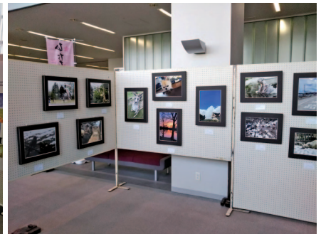
県北地区合同写真展風景

写真を共有して講習会を実施するのも、格段に容易になります。写真をより身近に感じられるように、また活動の幅をどんどん広げられるように、顧問としても大いに期待しているところです。