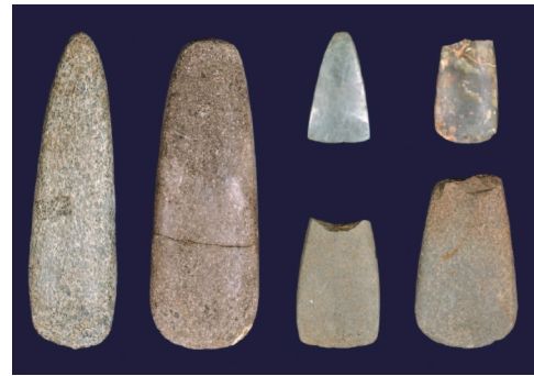
大近平遺跡出土の磨製石斧 (左端：全長14.5cm)

道具の原材料には、身の周りにある粘土・岩石・樹木・動物の骨角等が選ばれました。考古学では、磨製石斧のように岩石を加工して作られた道具を石器と呼んでいます。金属製の道具が存在しない縄文時代において石器は生活必需品であり、その用途に応じて様々な石器が作られました。そのうち磨製石斧は樹木の伐採や枝払い、住居柱材の加工