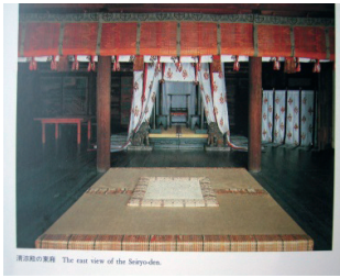
1. 宮中の御座所の御簾の狛犬