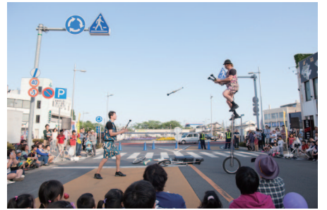
写真上は多賀会場、左は日立会場の風景。昨年に負けないパフォーマンスをぞうご期待！

■ご存じのとおり、ひたち国際大道芸は、日立会場と多賀会場の二か所において開催される。同じ場所で開催されるイベントはあるが、丸々会場が変わってしまうのはここ日立だけ。雰囲気が変わるので新鮮な気持ちで楽しめる