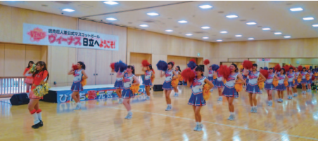
明秀日立高出場を記念してのジャイアンツ公式マスコットガール「ヴィーナス」によるダンス指導

野球場を開催することで プロになりたいと思う子供は たくさんいると思います。日立市からプロ野球選手がたくさん出るかもしれない。日立市出身であるときの教室に参加していた子どもたちならめ