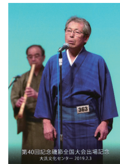
第40回記念磯節全国大会

わが日立にも昔から唄い継がれてきた民謡が沢山あります。日立は海があり、山があり、鉱業、農業、商業の作業の中で発展と共に唄い継がれてきた民謡を大切に継承することが必要と思っております。日立民謡民舞連合会ではこの大切な民謡を伝承する為に日立民謡研修会を開催しております。