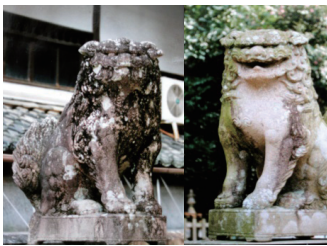
2. 組み合わせ例：阿吽型(石造)