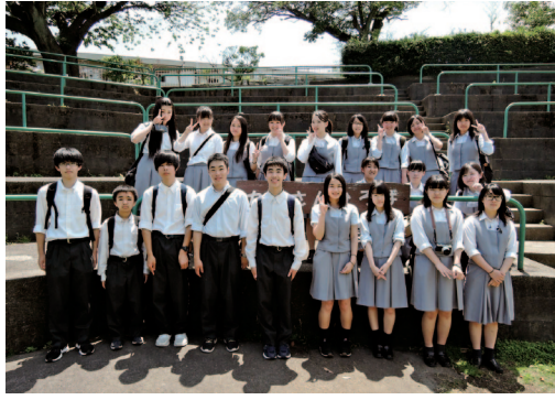
県北地区撮影研修会の一コマ(かみね動物園にて)

おもな活動は、まず茨城高文連写真部会の行事として毎年6月に実施される「写真講習会」に参加します。例年、講習会終了後に校内撮影会を実施しています。今年度は実施できなかったのですが、昨年度は会場近くにある弘道館で実施しました。7月には「県北地区撮影研修会」、9月には「茨城県撮影研修会」に参加します。