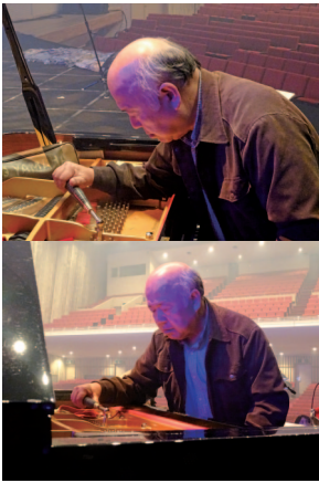
コンサート前、わずかな時間でピアノを仕上げる

ピアノは、納品時に無料調律がおこなわれます。そのため、販売員にはピアノに関する技術と知識が必要とされます。ヤマハサービスマン学校という短期間の研修機 関で研修を受けました。販売