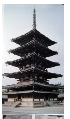
4. 法隆寺五重塔と 日本最古の狛犬

お金では買えません。 この貴重な財産であ る鎮守の森を私た ちは守り続けて行 かなければなりま せん。私たちの祖先