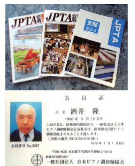
上:ピアノ調律師協会会報誌 下:協会会員証