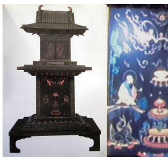
5. 法隆寺玉虫厨子の狛犬

逆に森への評価価値が低くなり、 この二千年にわたって森林が伐 採され市街地となり、都市部に あつては森林が残っている所は 鎮守の森しかありません。鎮守 の森は財産であり、その歴史は