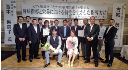
読売ジャイアンツ古城氏講演会

茨城県日立市出身 自動車販売店カリスマジャパン代表取締役 H27年NPO法人ひたち夢元気プロジェクトを有志で立ち上げ理事長を務める。