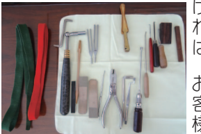
これらの道具を使いこなし音を整える

—— 人間は脳を使わないと老化してしまいます。絶えず新しいものに、諦めずに挑み続ける。これが重要だと思えます。また、お客様との話題に関するものが私の仕事だと思っています。お客様から信頼されてこそ成り立つ仕事です。そのために情報収集も怠りません。定年はありませんから健康に気を遣いながら頑張っていきたいですね。