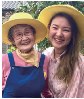
素敵なお孫さんとのツーショット

お店を始めるために物を仕入れたことはないんです。の部屋にかけてある着物や洋服は、以前私が着ていたものです。次女が日本とフランスを行き来してありまして、洋間の一部分を娘のコーナーにしてフランスで購入した小物などを置いています。そういった次第ですから、商売気は全くないんです。ただ、普段接点のない方にこの仕事を通してお目にかかることで、人生勉強をさせていただき、ひいては私の認知症の予防になればと思っています(笑)。