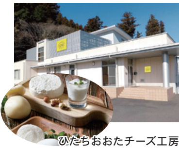
ひたちおおたチーズ工房