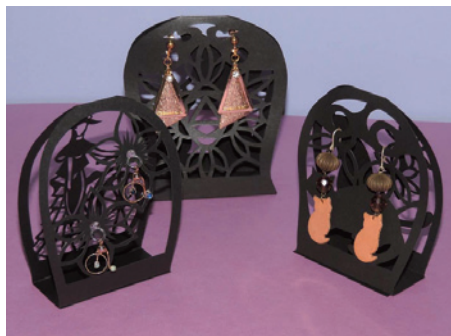
イヤリング・ピアススタンド

普通のポチ袋や御祝儀袋だったら、中身を取ってポイと捨てられてしまいかもしれませんが、切り絵のポチ袋だったら大切な宝