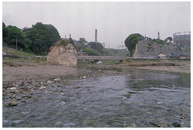
宮田川河口

「風土記」編纂からおよそ百年後に助川駅家は廃止されたが、「助川」の地名はその後も途絶えることなく現代まで続いている。ただ室町時代には「介川」、元禄の頃は「助川」、明治時代にまた「介川」と漢字表記は交互に変遷したようだ。鮭を取った河は現在の宮田川に比定され、幕末にはまだ鮭を捕ることがあったらしい。『新編常陸国誌』には「鮭ノ大ナルヲ須介ト云フコト、当国(常陸)ニハ今ハ絶エタラド、陸奥国南部及松前ノ土人ハ鮭ノ大ナルヲ佐介