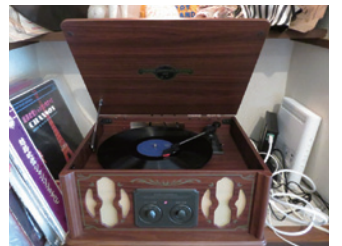
年代物のレコードプレイヤー

て、今でも音を出せます。お客様が好きなレコードを持ちよって、かけながらお茶を楽しむこともできますよ。囲碁の盤と石もあるのでこちらにも声をかけてくだされば自由に使えます。今は断捨離の時代ですから、うちのようなお店には逆風なんですけれど、できる限り続けていきたいです。混まないののでゆっくりできていいと言ってくださる方もいます。