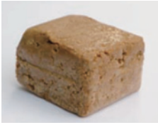
「蘇」:平安時代を再現した 当時のチーズ

1948年群馬県出身。1972年から日立在 住。NPO法人チーズプロフェッショナル 協会顧問。1995年から日立酒楽会(ひた ちささえ)を主宰。県北でチーズ、ワイン、 ウイスキーなどを楽しむ会を主催。 ワインエキスパート。チーズプロフェッ ショナル。フランスチーズ鑑評騎士。東京 ウイスキー&スピリッツコンペティ ション審査員。