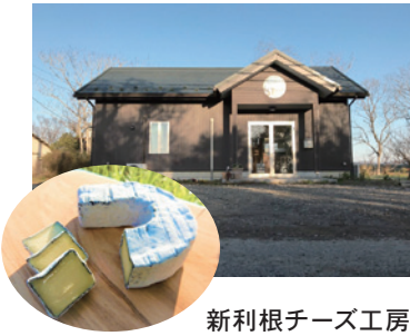
新利根チーズ工房

30年余のチーズ製造の歴史が あり、定期的に国内のコンテ ストに入賞し、国産チーズ製 造ではベテランのグループに 入ります。鈴木牧場は、土づ くりにごこだわった自然派工房 です。新利 根チーズ工 房は、4年 前に設立さ れた工房で すが、隣接 する放牧場 のストレス フリーな牛 のミルクを 使い頭角を現してきています。 ひたちおおたチーズ工房は里 美地区の自然豊かな環境で育 つ牛のミルクを使っており、 昨年2020年4月に製造開 始しました。 どの工房も特徴のある美味 しいチーズを造っています。 是非、皆さんも手に取って(地 元茨城の美味しいチーズを) 味わってください! 注記:(蘇)は牛乳を加熱濃縮した もの(推定)、(酪)は酸凝固チー ズ(一種(推定)、(白牛酪)は牛乳を加熱 凝縮し乾燥させたもの(推定)