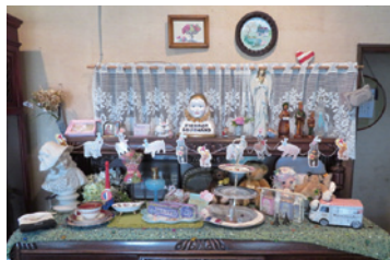
フランスらしい小物がずらりと…