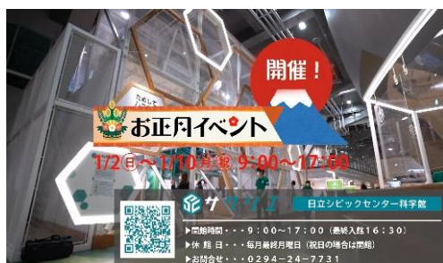
テレビ CM 科学館 お正月イベント(JWAY)