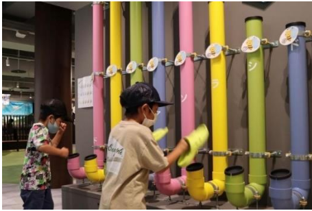
夏のイベント「謎解きはサクリエの中で」