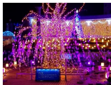
ひたちのヒカリ～花咲く未来～ 夢の桜