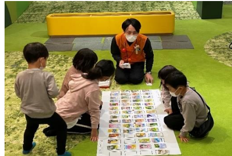
特別イベント「お正月イベント」