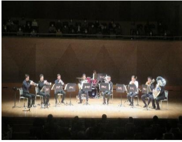
侍 BRASS 日立公演