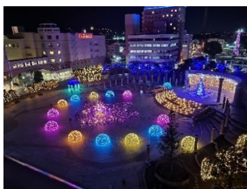
ひたちのヒカリ～花咲く未来～ 全景