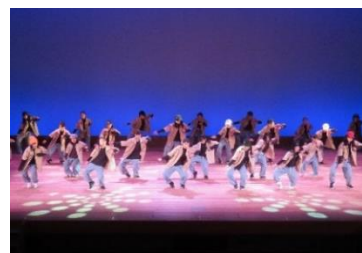
Civic Dance Fes.2021