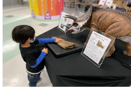
春のイベント「恐竜・化石コーナー」