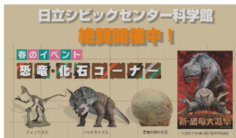
テレビ CM 科学館 春のイベント(福島テレビ)