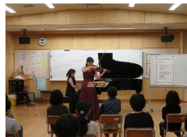
音楽アウトリーチ 「音楽室コンサート」