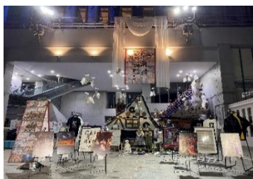
ひたち市民オペラによるまちづくりの会 ひたち市民オペラ25周年記念展