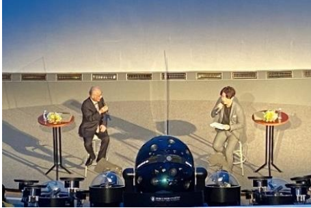
タッチ・ザ・スター上映記念イベント ～プラネタリウム番組上映&トークショー～