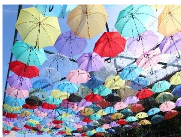
SUN SKY HITACHITAGA

日立市視聴覚センターとの共催事業として8月に企画していた「夏休み親子映画会 with ひたちシネマスペシャル」の中止に伴い、12月に開催時期を変更して映画の上映会を実施し、多くの親子連れに喜ばれました。