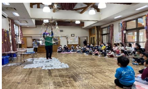
科学アウトリーチ 出張サイエンスショー