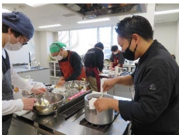
シビックサロン 「俺たちのバレンタイン」

また、声楽や管楽器によるコンサートの開催が困難ななか、新規アーティストとして弦楽器奏者2名を加え、感染防止対策を万全にした上で、市内小学校計9校を会場に「音楽室コンサート」を実施しました。