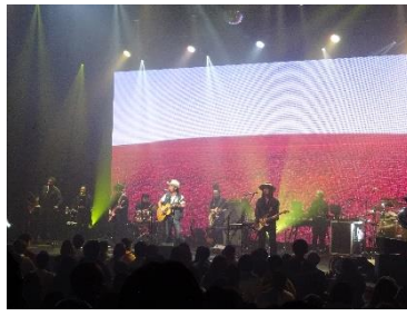
HIRAIDAI Concert Tour 2021-2022