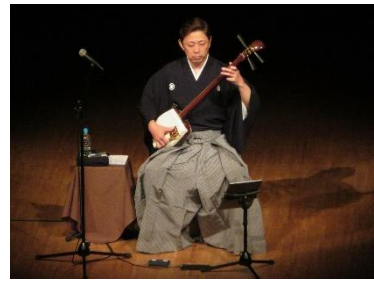
上妻宏光「生一丁！」Tour 2020-2021 “伝統と革新”