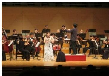
市民音楽企画記念コンサート ～共奏～

市民劇団による単独公演と、県北地区高等学校演劇部等による公演を実施しました。新たな取組として、中学生とその保護者を演劇公演へ無料招待し、鑑賞の機会を提供することを目的とした「中学生支援プログラム」を実施しました。