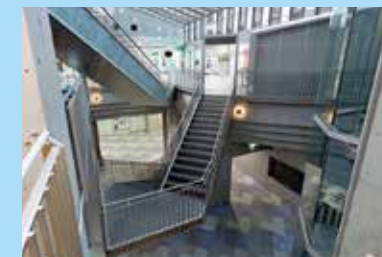
2 階段 (1階と地下1階の通路)