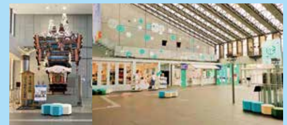
1 日立風流物 (集合写真) 1階アトリウム(来館時の集合場所) インフォメーション(受付) ミュージアムショップ(おみやげ)