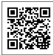
団体利用について

… スタッフがお出迎えますので、当館到着10分前に電話連絡をお願いいたします。☎0294-24-7731 ※天候などによるキャンセルの場合も、当日電話にてお願いします。