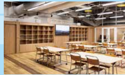
5 ひらめきアトリエ (工作会場)