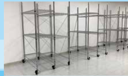
4 荷物置場 (こちらのラックをご利用ください) ※団体の利用状況により場所の変更があります。