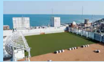
7 屋上 (昼食会場)