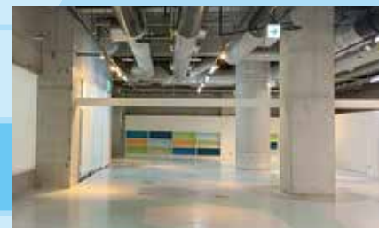
3 オリエンテーションルーム (昼食会場) ※昼食会場は他にもあります。